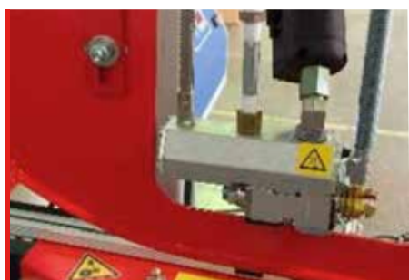
Cierre con Hot Melt (OPCIÓN)